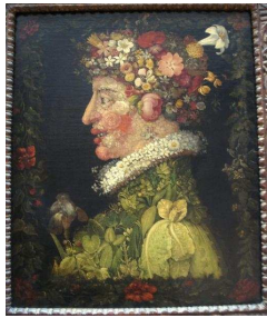
Allégorie du printemps

Il a représenté les 4 saisons sous la forme d'un profil humain. On appelle cela une allégorie .