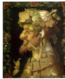
Allégorie de l'automne