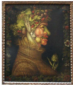
Allégorie de l'été