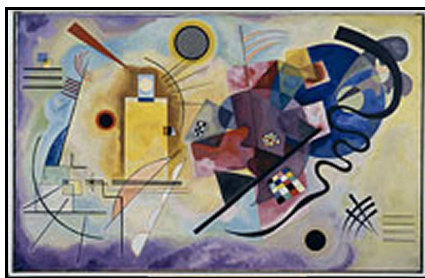
« bleu jaune rouge » de Kandinsky

Nous avons aussi travaillé à partir de « bleu jaune rouge » de Kandinsky .