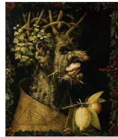
Allégorie de l'hiver