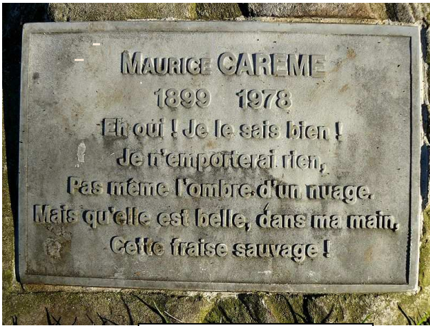
(Jardin des Poètes, Paris)

Il écrit des romans : Un trou dans la tête, La Bille de verre